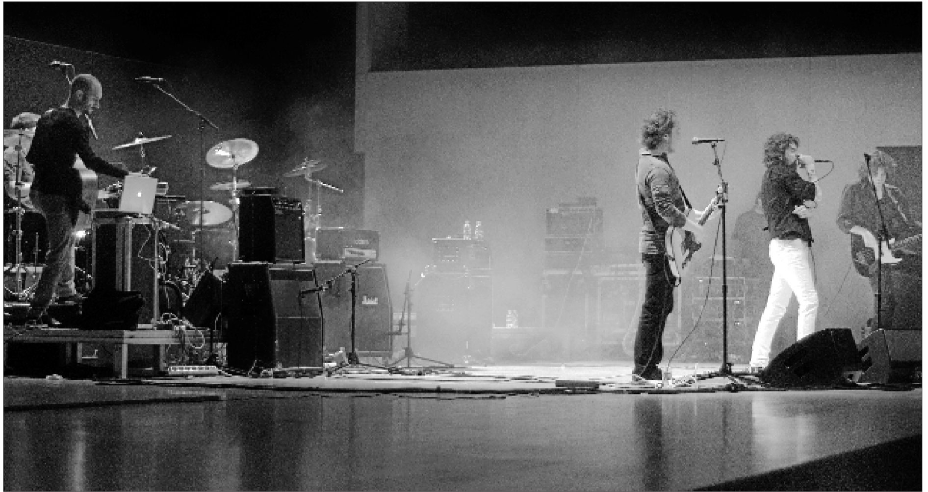
Los componentes del grupo durante un momento de su última actuación en la sala de cámara del Auditori i Palau de Congressos. LEVANTE-EMV

LOS MEJORES DISCOS PROVINCIALES DE LA DÉCADA (2/10) ► CON EL PRIMER TRABAJO DE LA BANDA VILA-REALENSE ULTIMABALA CONTINUAMOS LA SERIE DE DIEZ REPORTAJES EN LOS QUE PERSONAJES REPRESENTATIVOS DE LA MÚSICA EN CASTELLÓ ELIGEN PARA LEVANTE-EMV SUS GRABACIONES PREFERIDAS